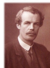
ARTHUR CECIL PIGOU