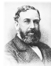
WILLIAM STANLEY JEVONS