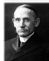
JOHN BATES CLARK